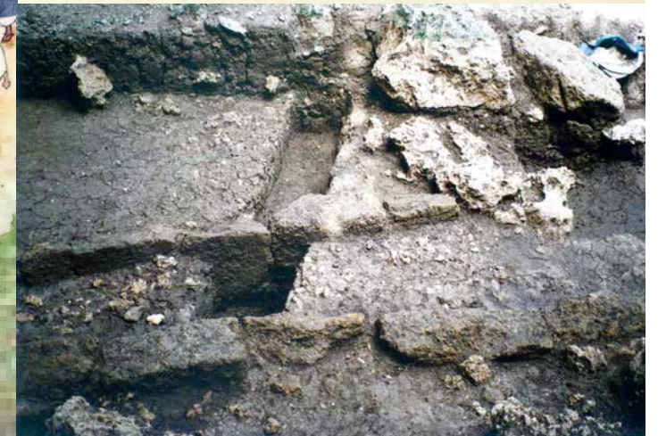
発掘調査で確認された三庫理(サングーイ)前の排水溝

発掘調査の結果、様々な遺構が確認できました。石畳の参道の下をくぐりぬける排水溝や、祈りの場を清めた白砂の堆積などがそれです。