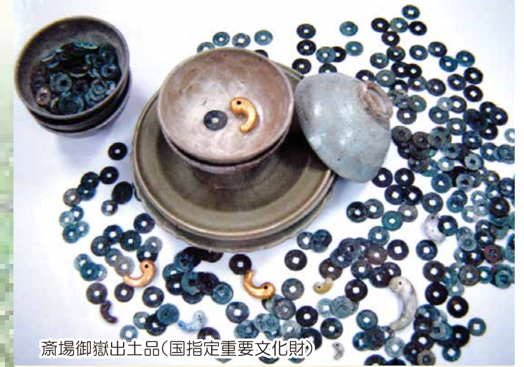
斎場御嶽出土品(国指定重要文化財)

⑤ 三庫理(サングーイ) 三角形の空間の突き当たり部分には三庫理。右側の岩の上がチョウノハナで、それぞれが拝所となっています。また左側には海の彼方に久高島を望むことができます。