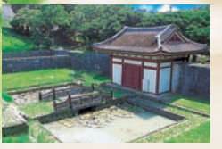
엔각사총문과 방생교 왕족의 보살절. 총문 뒤쪽의 방생교의 릴리프는 국가지정 중요문화재. ※ 슈리성터는 2000년 12월 '류큐왕국의 구스쿠 및 관련 유산군'으로서 유네스코 세계문화유산에 등록되었습니다.