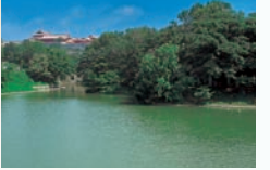
류탄 책봉사의 진언에 의해, 1427년에 조성된 인공연못.