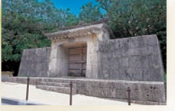
소노한우타키이시문 국왕이 외출시, 도종의 무사평안을 이 들문에서 기원했다. ※세계유산