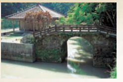
베자이텐도우와 엔간치 조선왕으로 부터 보내진 만해장경을 보관하기 위해 건설되었다.