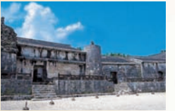
왕능(타마우둔) 제2소세 왕릉의 능묘. 3개의 묘실에 역대 국왕과 가족이 안치되어 있음. ※세계유산