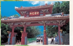
수레문(슈레이문) 쇼신왕시대(1527 ~ 1555)에 창건. 편액「예절을 지키는나라」 또는「류큐는 예절을 중요시하는 나라」라는 의미.