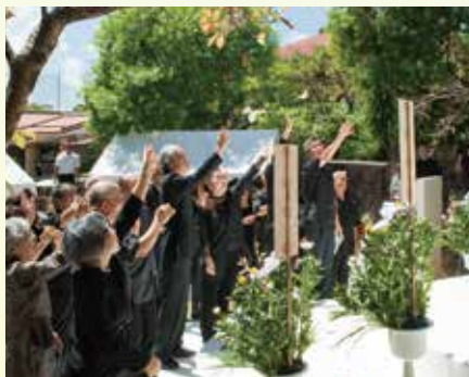
在慰靈祭時向天空放飛祈求和平的蝴蝶

通過每年6月舉行的「小櫻花之塔」的清掃活動及對馬丸的戲劇，學習戰爭的恐懼及和平的珍貴，開展『學習和平』活動。勿忘戰爭悲痛的事實，一起來思考關於和平之路吧。