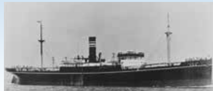
對馬丸 據說從縣內各地集合的學童，普通疏散（疎開）者共計1661名乘坐了該船。

1944年，戰爭的腳步聲慢慢逼近沖繩；應國家政府的命令老人・婦女及孩子被安排向縣外疏散（疎開）。對馬丸號乘載的許多學童被集體疏散（疎開），於8月21日從那霸港出港。可是，那時的海洋也已經成為戰場。翌日22日的晚上10點過後，在鹿兒島縣tokara列島的惡石島附近海域，被美國潛水艇Bowfin號的魚雷攻擊沈入海裏。船上所乘1788名（包括船員・兵員）裏面約8成的人同時消失在茫茫大海裏。