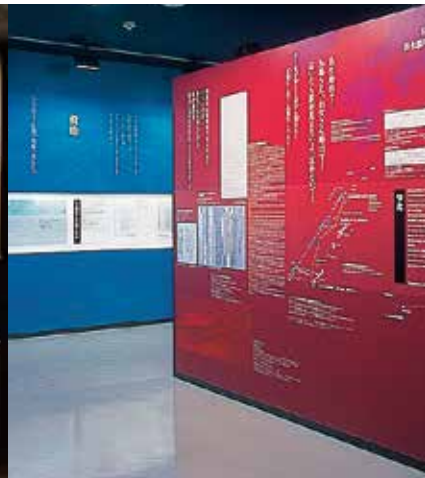
對馬丸的航線圖及美軍潛水艇擊沉對馬丸的記錄及監聽到的電文和破解文展示於此。