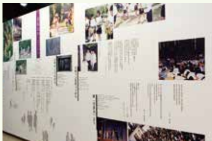
展示著通過對馬丸事件所辦的和平活動的情況。

將對馬丸作為通向和平的路標 願望是以各地兒童作為活動主體， 在各地緊密紮根。 針對波濤中飄浮的犧牲者靈魂 現在活著的我們， 又該如何應對呢？