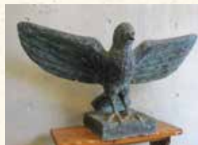
小櫻花之塔上部有獨創的鴿子石膏像