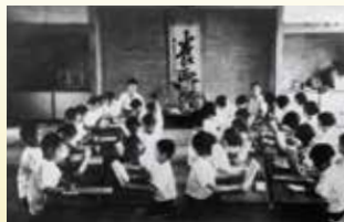
泊國民學校 （當時的小學校） 的疎開學童

在戰爭愈演愈烈的情況下，受國家政府的命令，由上年紀的人及女性，孩子等集體向安全地帶轉移，在此集體避難疏散被稱作『疎開』。以及在沖繩，以每所學校為單位的集體疏散（疎開）被稱作『學童集體疎開』。